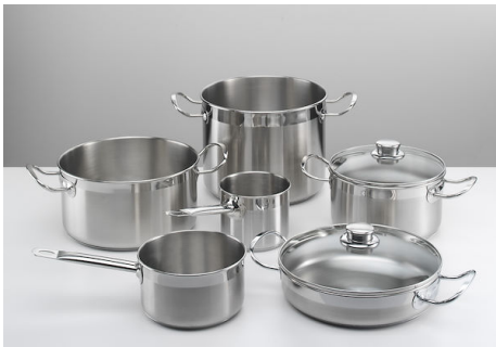
Batería de cocina Induction PRO 8 pz.